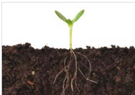
Fröplanta med friskt rotsystem.