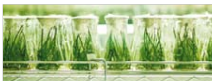
Överst ovan: Växthus med växter i kruka. Nederst ovan: Laboratoriefremställd fröplanta med högteknologisk lysrörsbelysning.